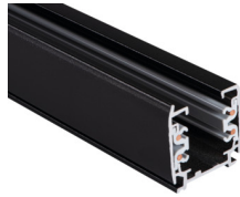
33231 TEAR N TR 1M-B

Elemento di sistema a sbarra, TEAR N TR 1M-B, sbarra collettore a 3 circuiti, nero, (33231)